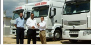
Yunus Emre Nakliyat'ın yeni araçları